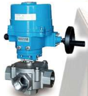
ST同軸式電動五通閥 (保用五年)